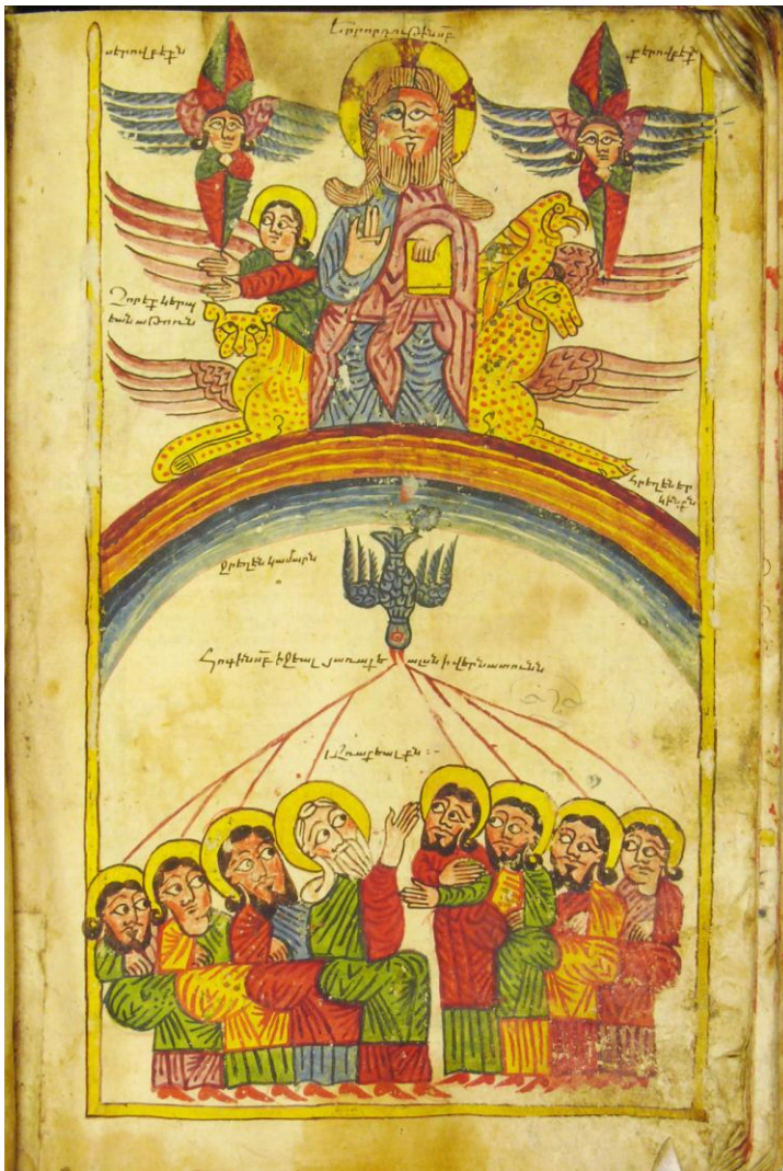
Հոգեգալուստ (Մատեն., ձեռ. 5543), Ավետարան, 1436 թ., Աղթամար, նկարիչ՝ Դանիել:

Վասպուրականյան մանրանկարների կերպարները ներկայացվում են հարթ, գրեթե ձուլված թերթի մակերեսին, գծապատկերային՝ երբ հստակ ուրվագծվում է կերպարը թերթից տարանջատող գիծը, ծավալային՝ երբ կերպարի հագուստի ծալքերը ձևավորող գիծը ընդգծում է մարդու մարմնի կառույցը: Նմանօրինակ դեր ունի նաև կերպարի գունավորումը, որի հագեցվածությունն ու զանազան երանգների համադրությունը նույնպես կարող է ընգծել մարմնի ծավալը: