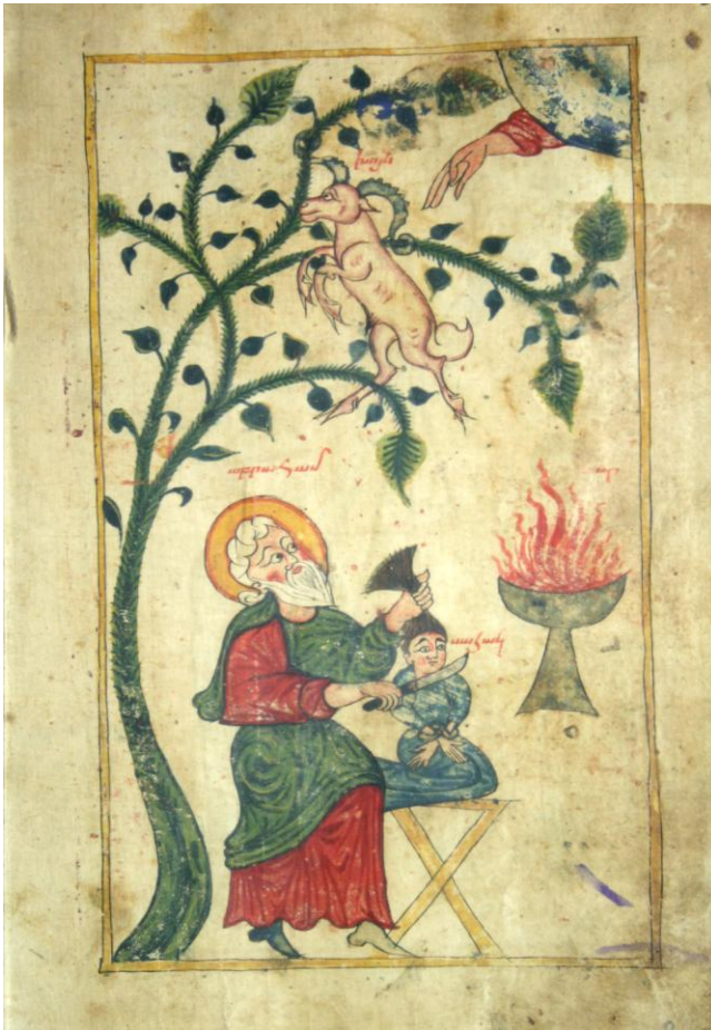
Բահակի գոհաբերությունը (Մատեն., ձեռ. 3717), Ավետարան, 1394 թ., նկարիչ՝ Հովհաննես Խիզանցի:

Վասպուրականի մանրանկարներում տիրապետողը պատկերի ստեղծական երկու հիմնական սկզբունքներն են՝ սիմվոլիկ-նշանակային և պատմողական : Այսինքն մի դեպքում պատկերագրական տեսարանը ներկայացվում է խիստ համառոտ, գրեթե սիմվոլի (խոհրդանշանի) վերածված տարբերակով, մյուսում՝ խիստ պատմողական, ավելի հանգամանալից կերպով: Հանդիպում են ձեռագրեր, որտեղ այս սկզբունքները զուգադրվում են: